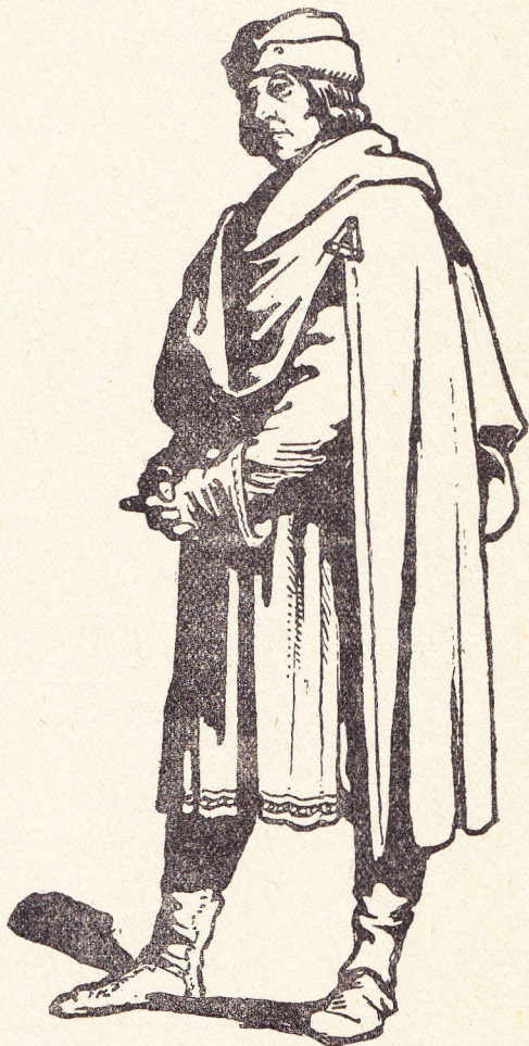
Eenen poorter 12e eeuw.

— Graaf, sprak hij tamelijk ruw, denk goed na op wat er hier